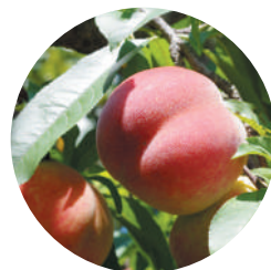
桃葉エキス 山梨モモ