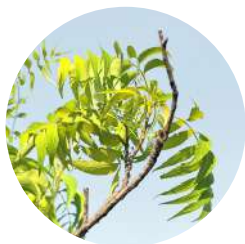
ニーム葉エキス (奇跡の木) メリアアザジラクタ葉エキス