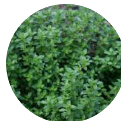
ワイルドタイムエキス (オーガニック)