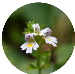
アイブライトエキス (オーガニック)