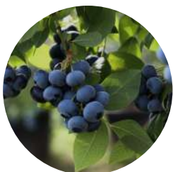
ビルベリー葉エキス (オーガニック)