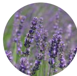
ラベンダー花エキス (オーガニック)