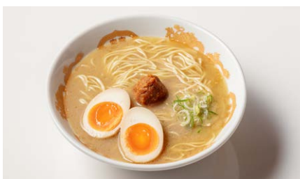
山吹 白 味玉 880円(税込)