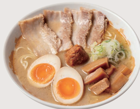
山吹 白 全部のせ 1,400円(税込)

香りと麺の甘味が生きる「白山吹」「山吹減塩」「山吹麴甘味噌」など、甘味が特徴の3種の味噌を使用し、信州さのこ豆乳を合わせた、味噌ポタージュのようなクリーミーな味わいです。品の良いあっさりとした味は優しく、今までの味噌ラーメンの概念を変えます。バランス良く様々な味が織りなす一杯は、最後まで飽きることのない味です。