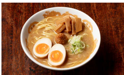
山吹 赤 味玉メンマ 1,050円(税込)