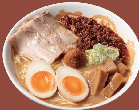
山吹 赤 辛味野沢菜 1,400円(税込)

1年に1度、ご予約をいただいたお客様だけのために仕込む当社の最高級味噌「豫約醸造味噌 山吹」をたっぷり使用しており、味噌の風味を存分にお楽しみいただけます。鶏白湯を中心に魚介系と野菜系の味が混ざり合い、旨味が広がる凝縮されたスープは、味噌との相性が抜群で食べ進めていくにつれて美味しさが増していきます。辛味野沢菜のトッピングがオススメです！