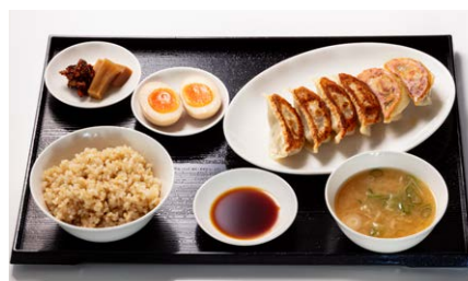
餃子定食(6個) 1,300円(税込)