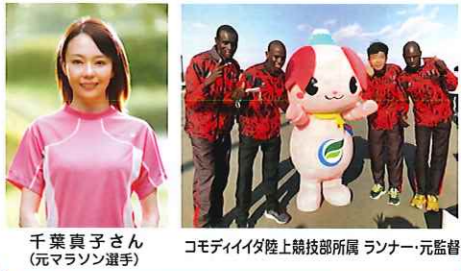
千葉真子さん(元マラソン選手) コメディイタ陸上競技部所属 ランナー元監督

■主催：ふじみ野市 / ふじみ野市スポーツ協会 / ふじみ野市指定管理者 アイ・オーエンスグループ ■主管：ふじみ野市ロードレース大会実行委員会 ■協力：上福岡総合病院