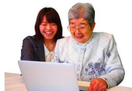
マンツーマンで効率よく学習 インターネットで自己実現！

パソコン教室で学習という手段もありますが、どちらかという若い生徒さん向きで、繰り返しわかるまで学習したいという方にはあまり向いていません。一人のインストラクターが5名以上担当しますのでなかなか質問もしづらいようです。