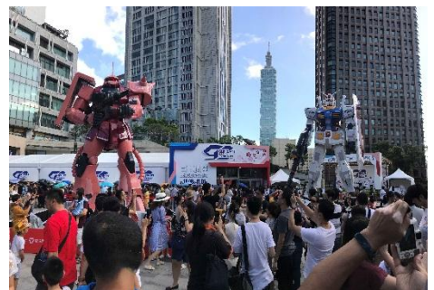
「GUNDAM docks at TAIWAN」