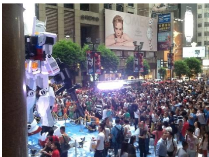
「GUNDAM docks at Hong Kong」

2013年の香港タイムズスクエアでの「GUNDAM docks at Hong Kong」を皮切りに、これまで香港、シンガポール、台湾でガンダムと大型商業施設がコラボした、海外発のガンダム大型イベントです。2017年10月の「GUNDAM docks at TAIWAN」では、連日大盛況が続き、非常に話題となりました。今回、初めて日本で開催します。会場では、ガンプラ(「ガンダムシリーズ」のプラモデル)をモデルにした、大型立像の展示や、限定グッズの販売など、施設がガンダム一色に染まります。