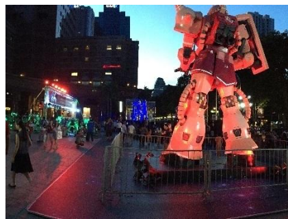
「GUNDAM docks at SINGAPORE」