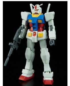
※組立体験教室用ガンプラ