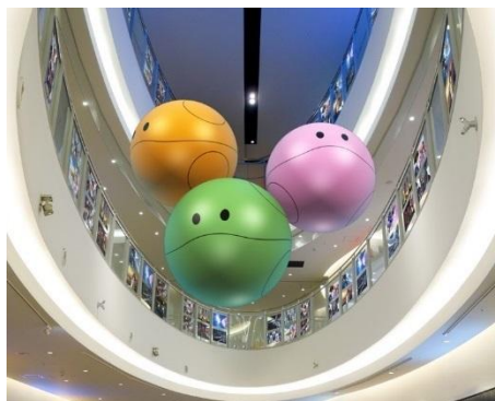
※ハロバルーン イメージ