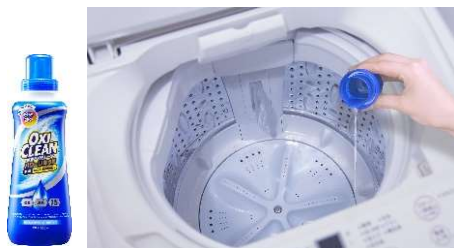
オキシクリーンパワーリキッドを使った オキシ足し