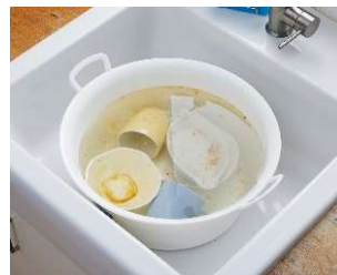
オキシクリーンを使用した 食器のオキシ漬け

衣類用の漂白剤として広く使われている液体タイプの酸素系漂白剤は、洗濯洗剤だけでは落としにくい汚れとニオイを落としてくれるお役立ちアイテムです。汚れは落としたいけど手間はかけられないという忙しい方には、簡単に使える液体タイプの「オキシクリーン パワーリキッド」はおすすめです。衣類の抗菌・ウイルス除去ができるのもポイントですね。一方、粉末タイプの「オキシクリーン」は、頑固な汚れやニオイのついた衣類の洗濯に加え、食器の茶渋を落としたり、窓ガラスの汚れにも使えたりと家中のお掃除でお使いいただけます。まずは洗濯には液体タイプの「オキシクリーン パワーリキッド」、お掃除には「オキシクリーン」と使い分けてみてください。