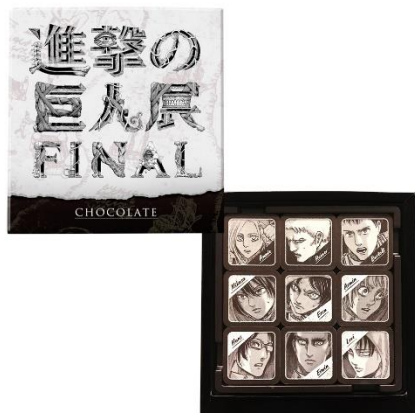
ビジュアルチョコレート 2,400円(税抜)

東京展でも人気の高かったエレン・ミカサ・リヴァイなどのキャラクターグッズをはじめ、大阪展より販売が開始されるグッズも続々登場。連載10周年記念ビジュアルや大阪展限定アニメ描き下ろしイラストを使用したグッズの販売も決定。「ビジュアルチョコレート」や新ビジュアルも加わった「クリアファイル3枚セット」など注目のラインナップが目白押しです。