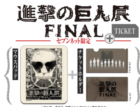
進撃の巨人展 FINALビジュアル巨人ver. マウスパッド+チケットホルダー付