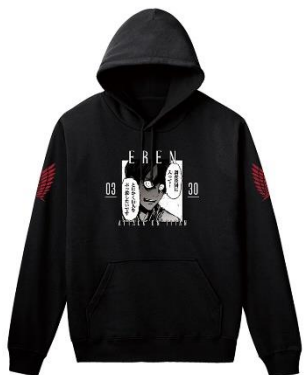
シーンパーカー エレン 5,980円(税抜)