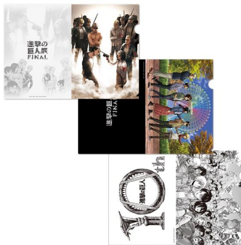
クリアファイル3枚セット コミックス29巻・アニメ描き下ろし 10周年記念ビジュアル 1,000円（税抜）