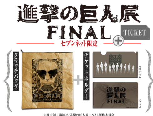
進撃の巨人展 FINALビジュアル巨人ver. クラッチバッグ+チケットホルダー付