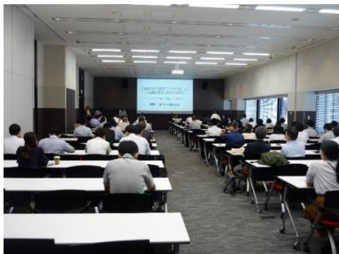
プレゼンテーション会場

【参加者数】 1586名（〔内訳〕会場参加321名、オンライン参加延べ1265名）