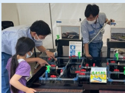
【災害時でも水が出る仕組み】