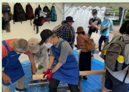
【間伐材の丸太切り体験】