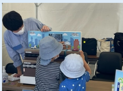
【地震に強い水道管の仕組み】