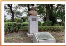
ヘンリー・スペンサー・パーマーの碑