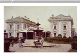
停車場正面と噴水塔