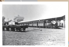
停車中の列車(横浜停車場)