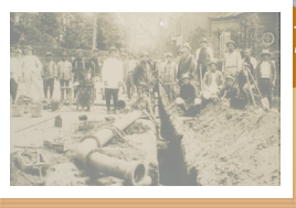
明治30年代ごろの 山手地区配管工事の様子