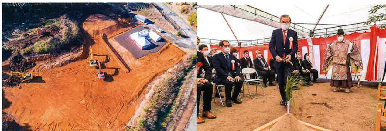
当社熊本県大津町半導体関連部材工場新拠点用地の様子

(株) フェローテックホールディングス 熊本県大津町の生産新拠点で3月2日(木)に地鎮祭を実施 ～半導体製造装置向け部材、サービスの事業展開を準備中(2024年5月竣工予定)～