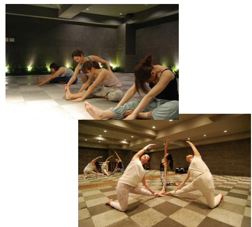
豊富なレッスンプログラムを提供

※マグマスパスタジオは、(株) マグマスパジャパンが特許を持つ体温上昇スタジオです。