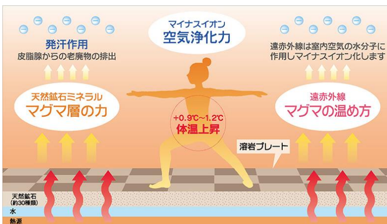
マグマスパスタジオのしくみ

「ほどよくラグジュアリーなホット体験をラクに---」。そんなネーミングの由来を持つ新ブランドを立ち上げ、ティップネスは、今後も現代人の様々なニーズに応えるべく、多様な形態でのサービス提供を模索していきます。