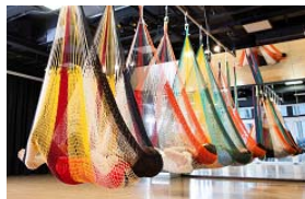
ハンモックエクササイズ

ティップ.クロス TOKYO 提供 「楽しい本格派エクササイズプログラム」 主なラインナップ>>