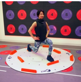
ランジ系種目 （主に下肢の筋トレ） ⇒おしりの引き締め