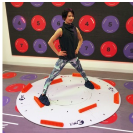
アダクション系種目 （主に下肢の筋トレ） ⇒内ももの引き締め