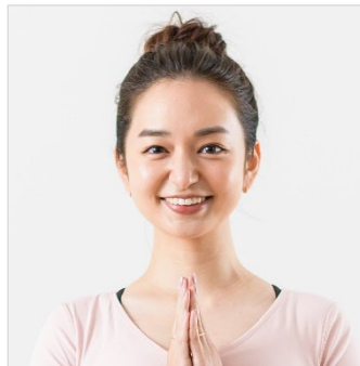
後藤晴菜アナウンサー