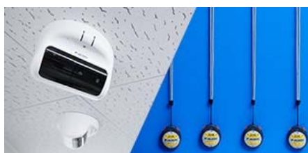
最高水準のセキュリティ！