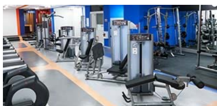
リーズナブルな月会費！