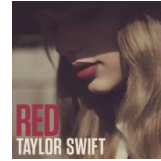
TAYLOR SWIFT RED ¥2,190 (tax out) POCS-24004