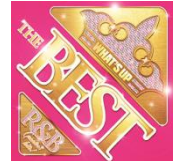
WHAT'S UP THE BEST THE GREATEST R&B HITS! ¥2,778 (tax out) UICZ-157980