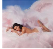
KATY PERRY TEENAGE DREAM THE COMPLETE CONFECTION ¥1,886 (tax out) TOCP-71194