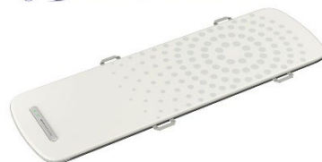
眠りSCAN 見守りセンサー