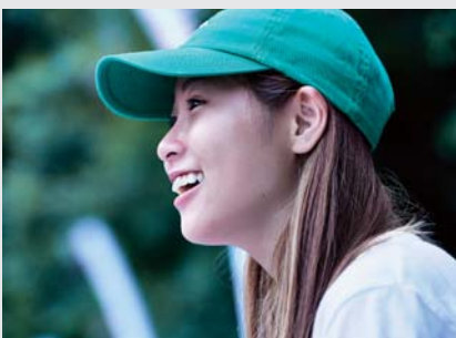
西村 碧莉 (スケートボード / 16才) 2017年 X GAMES Women's Skateboard Street 優勝