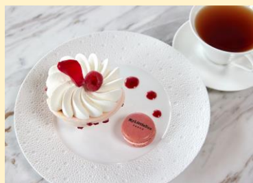
ヴァシュラン イスパハン