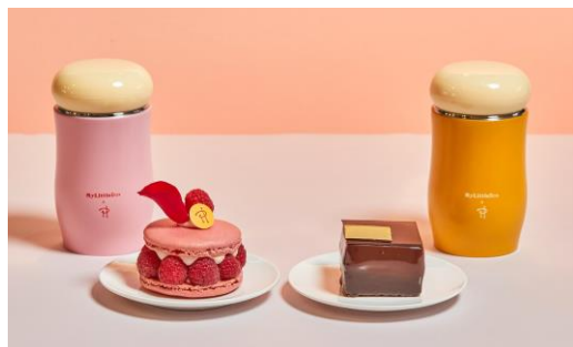
(左)「イスパハン」コラボ (右)「キャレマン ショコラ」コラボ

サーモボトルはスイーツをイメージしたフェミニンなデザインで、温かい温度をキープできる保温機能も付いているため、これからの季節にぴったり。気分まで明るくなるようなスイーツカラーのサーモボトルと一緒に気分転換をし、お出かけをしてみましょ♪ そして、お気に入りのドリンクを入れて、スイーツと一緒に至福の時間をお過ごしください。