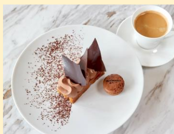
ミルフィユ ミニユット アンフィニマン ショコラ パリ