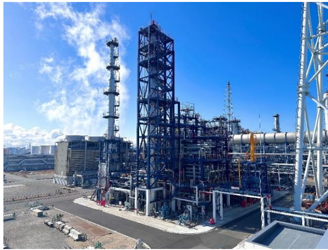
SAF 製造装置（コスモ石油堺製油所構内）

コスモエネルギーグループは「2050年カーボンネットゼロ」をめざしており、日本初の国産 SAF 供給に向けてサプライチェーンを構築しています。また、SAF 原料への再利用を目的として、サービスステーションでの廃食用油の市民回収実証を継続的に展開するなど、社会全体の機運醸成も後押ししています。今後も、脱炭素化や循環型社会の実現を重要なテーマと認識し、社会的課題の解決と企業の持続的発展をめざすとともに、引き続き航空輸送における SAF 活用を推進し、資源循環とサステナブル社会の実現に貢献してまいります。