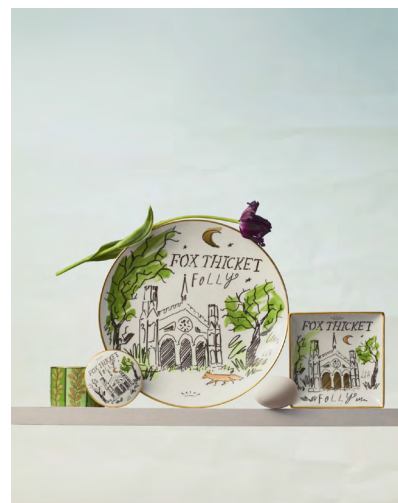
スクエアトレイ ¥18,700- プレート27cm ¥23,650- 蓋付ボックス ¥24,970-