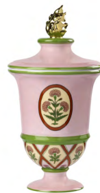
フタ付き壺キャンドル ¥102,300-

カルダモン、シナモン、クローブオイル、コリアンダーシード、パチョリ、ローズオイル、サンダルウッド、ストラックス