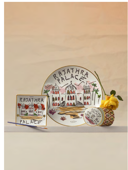
スクエアトレイ ¥18,700- プレート27cm ¥23,650- 蓋付ボックス ¥24,970-