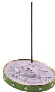
インセンスホルダー ¥37,950-