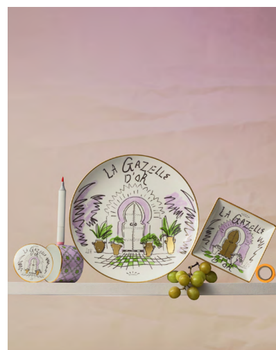
スクエアトレイ ¥18,700- プレート27cm ¥23,650- 蓋付ボックス ¥24,970-