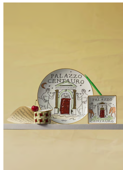
スクエアトレイ ¥18,700- プレート27cm ¥23,650- 蓋付ボックス ¥24,970-