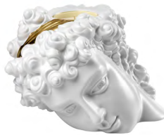
キャンドルヘッド ¥253,000-

知られざる者の手で作られた青年像の一部であろう頭部は 光と闇が交差し影が入り組むケンタウルの館で発見された。