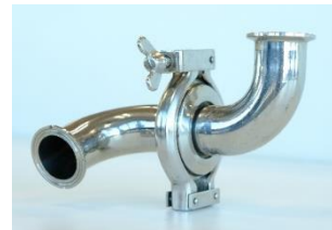
さまざまな形のスイベルジョイント製品がございますので、柔軟に配管設計が可能です。

TBG のスイベルジョイントはその高い品質から安全第一の施設で使用され、日本国内の石油備蓄タンク内の用途としては圧倒的なシェアを誇ります。今回出展するのは石油タンク内などに使用する製品ではなく、サニタリー（衛生的な、という意味）用途の製品で、医薬品・化粧品・食品など皮膚に触れるものや、口に入るものを製造する、衛生基準が非常に厳しい製造現場で用いられるスイベルジョイントです。また、サニタリー配管に求められる ISO 規格をクリアしている継ぎ手および食品衛生法に適合したパッキンを採用しており、多くの飲料・食品メーカーで採用いただいております。