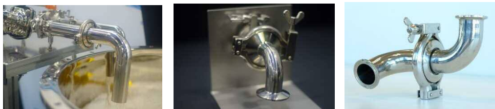
さまざまな形のスィベルジョイント製品がございますので、柔軟に配管が可能です。

サニタリー配管に求められる ISO 規格をクリアしている継ぎ手及び食品衛生法に適合したパッキンを採用したサニタリースィベルジョイントをご覧に、ぜひ弊社スペース（インテックス大阪 3号館 小間番号：6-25）にお立ち寄りください。皆さまのご来場を、心よりお待ちしております。