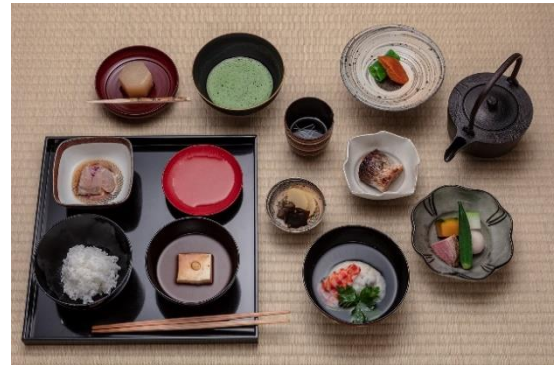
即今コースの一例

『南青山 即今』では、新しい日本文化の楽しみ方を提案している即今を存分にお楽しみいただける茶懐石コース3種をご用意しております。全てのコースは、お茶事をベースにしたオリジナルメニューで、茶室での抹茶、広間での懐石料理、オリジナルカクテルをお楽しみいただけます。お茶事は、元来お点前だけではなく、亭主との会話や季節の料理を楽しむことも、目的の一つにしており、初めてお茶事を体験される方も、すでに茶の湯を嗜まれている方も新しい発見に満ちた時間をご提供いたします。