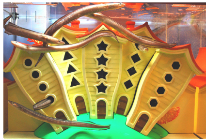
左:一緒に遊ぼうゾーン(赤ちゃん水族館内)