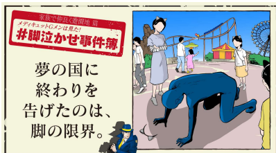
夢の国に終わりを告げたのは、脚の限界。