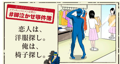
恋人は、洋服探し。俺は、椅子探し。