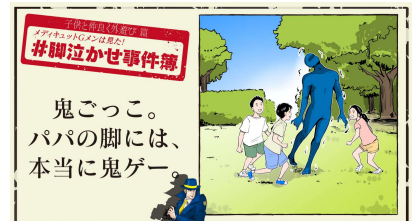
鬼ごっこ。パパの脚には、本当に鬼ゲー。