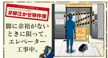
脚に余裕がないときに限って、エレベーター工事中。