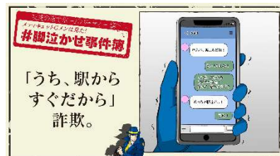
「うち、駅からすぐだから」詐欺。