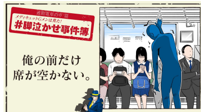
俺の前だけ席が空かない。