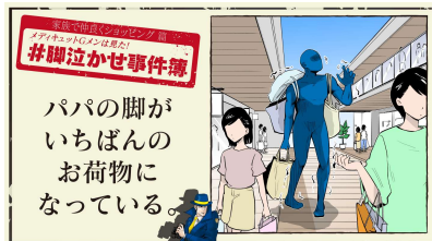
パパの脚がいちばんのお荷物になっている。