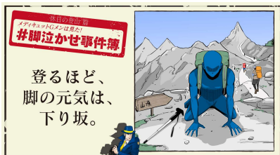
登るほど、脚の元気は、下り坂。