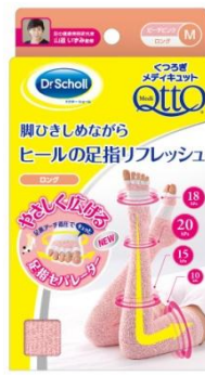
くつろぎメディキュット 足指リフレッシュ ロング