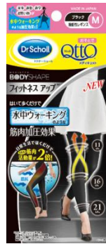
メディキュット ボディシェイプ フィット ネスアップ™