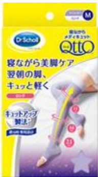
寝ながらメディキュット ロング