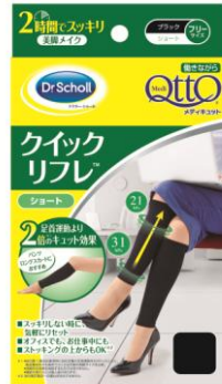
働きながらメディキュット クイックリフレ ショート