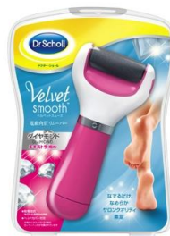
ベルベツスムーズ ダイヤモンド エキストラ