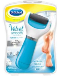
ベルベツスムーズ ダイヤモンド