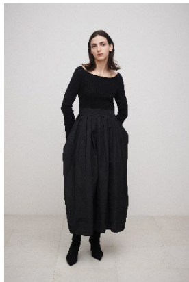
タフタドッキングニットドレス