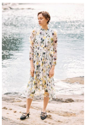
デジタルフラワープリントワンピース