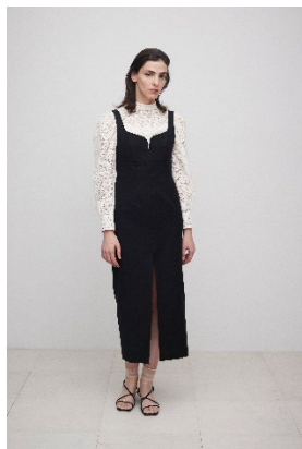
パワーショルダーレースブラウス