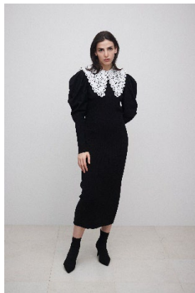
レースカラーニットドレス