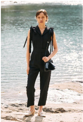
ショルダーリボンコンビネゾン