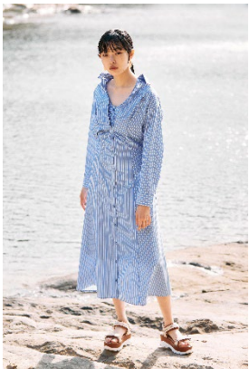
オリジナルシャツシリーズ