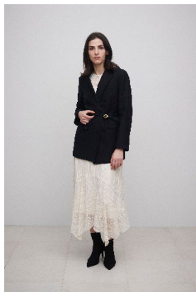
コットンキュブラテールードジャケット