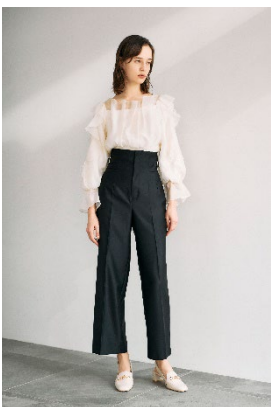
ソフトオーガンラッフルブラウス