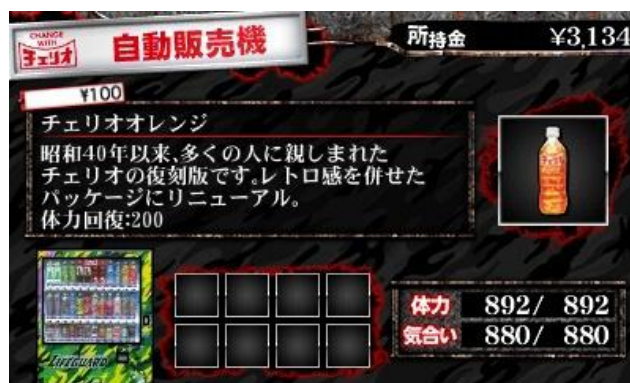
商品購入画面では、詳細を確認することができる