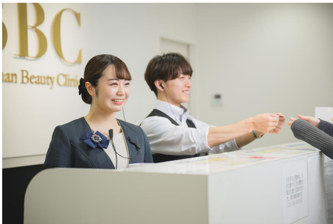
※クリニックイメージ

SBCメディカルグループホールディングス（米国カリフォルニア州、CEO：相川佳之）が経営支援を行う湘南美容クリニックは、2025年2月26日（水）に「湘南美容クリニック南越谷院」を新規開院いたします。JR武蔵野線「南越谷駅」、東武スカイツリーライン「新越谷駅」の2駅より徒歩1分の好立地にあり、隣駅には大型ショッピングセンター「イオンレイクタウン」もあるため、お買い物ついでに無料カウンセリングを受けていただくことも可能です。湘南美容クリニックでは、これからもお客様のご要望を迅速に取り入れ、美容医療をより多くの地域へ届けられるよう、さらなる発展を目指してまいります。