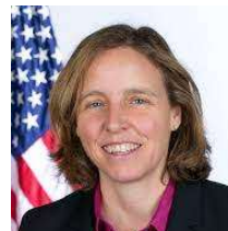
Megan Smith Former VP of Google, Chief Technology Officer of the United States