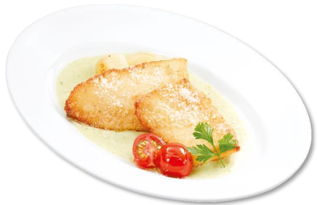
黄金カレイのパン粉焼き ～バジルクリームソース～ 490円（税込539円）

チーズソース入りのジューシーなハンバーグにさらにチーズをのせ、表面を香ばしく炙った一品です。デミグラスソースや、付け合わせの燻製ポテトとご一緒にお召し上がりください。