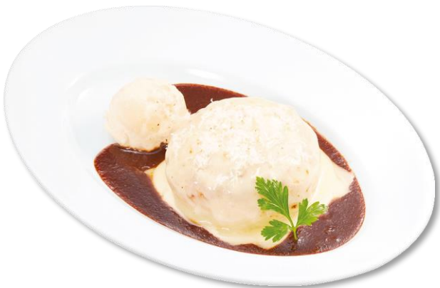
炙りチーズハンバーグ 490円（税込539円）

チーズソース入りのジューシーなハンバーグにさらにチーズをのせ、表面を香ばしく炙った一品です。デミグラスソースや、付け合わせの燻製ポテトとご一緒にお召し上がりください。