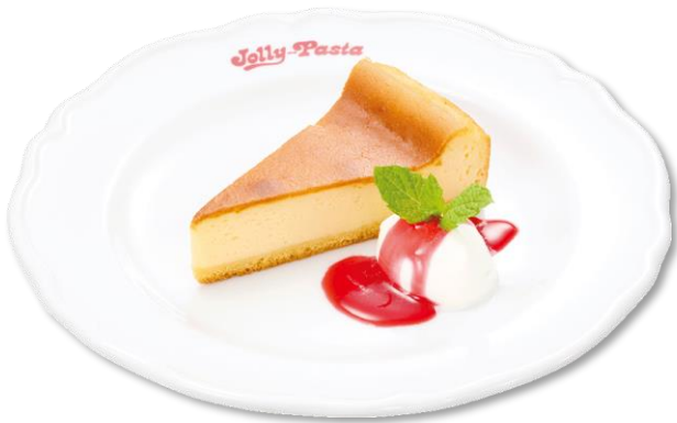
バイクドチーズケーキ 390 円 (税込 429 円)

食後にちょうど良いサイズのバイクドチーズケーキです。焼き加減にこだわり、しっとりとした食感に仕上げました。濃厚なチーズケーキを、ホイップクリーム、フランボワーズソースと一緒に楽しみください。