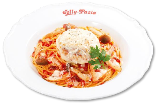
炙りチーズハンバーグのトマトソース 1,090 円 (税込 1,199 円)

黄金カレイのパン粉焼きやアサリのむき身、シメジ、トマトなどを使った、具たくさんなペペロンチーノです。香ばしくふっくらとした身のカレイは、風味豊かなペペロンチーノと相性抜群。イタリア産バジルペーストを混ぜると、爽やかな風味への変化をお楽しみいただけます。