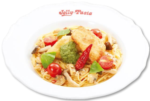
黄金カレイとバジルのペペロンチーノ 990 円 (税込 1,089 円)

黄金カレイのパン粉焼きやアサリのむき身、シメジ、トマトなどを使った、具たくさんなペペロンチーノです。香ばしくふっくらとした身のカレイは、風味豊かなペペロンチーノと相性抜群。イタリア産バジルペーストを混ぜると、爽やかな風味への変化をお楽しみいただけます。