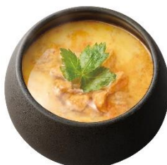
コク旨あんきも茶碗蒸し 260 円 (税込 286 円)