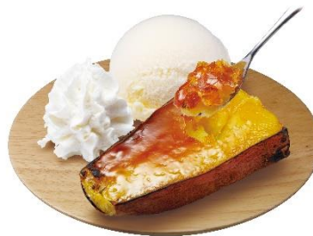
ひんやり焼き芋ブリュレ バニラアイス添え 200 円 (税込 220 円)