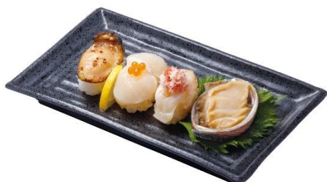
貝づくし 650 円 (税込 715 円)