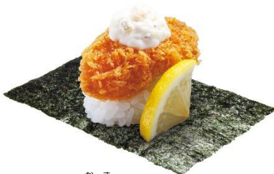
広島県産 牡蠣のカキフライつつみ (タルタルソース) 100 円 (税込 110 円)