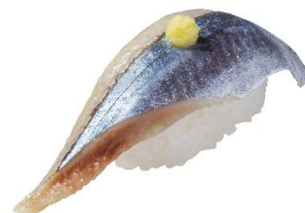
宮城県産 さんま 150 円 (税込 165 円)