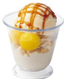
お月見ミニパルフェ 200 円 (税込 220 円)