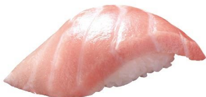
地中海産 本鮪大とろ 290 円 (税込 319 円)