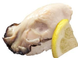
広島県産 牡蠣握り 100 円 (税込 110 円)