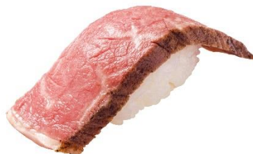
いわて牛五ツ星握り 290 円 (税込 319 円)