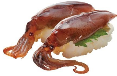
福井県水揚げ 漬けほたるいか 100 円 (税込 110 円)