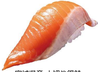
宮城県産 大切り銀鮭 100 円 (税込 110 円)