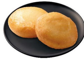
いまかね 今金男爵チーズいももち 200 円 (税込 220 円)