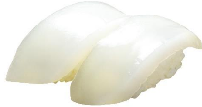
沖縄県産 そでいか 150 円 (税込 165 円)