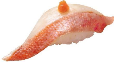
青森県水揚げ 金目鯛(もみじおろしのせ) 150 円 (税込 165 円)