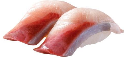
宮崎県産 黒瀬ぶり 150 円 (税込 165 円)