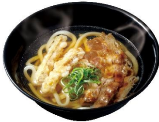
肉ごぼう天うどん 330 円 (税込 363 円)