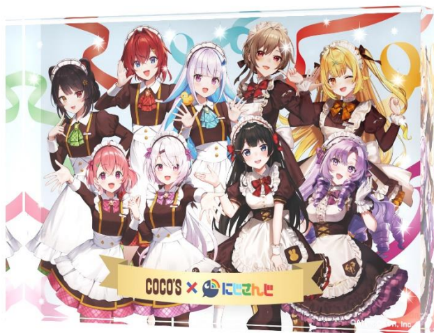
ココスオリジナルアクリルブロック

対象メニューをご注文いただいたお客様のレシートに、その場で抽選結果が分かる応募コードを印字します。応募ページにアクセスし、応募コードを入力すると、対象メニュー1品のご注文につき1ポイントが付与されます。1ポイントごとに、「ココスオリジナルアクリルブロック」が100名様に当たるWEB抽選に応募できます。