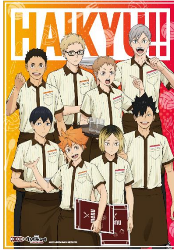
ココスオリジナル A3 クリアポスター

2月15日(木)~2月21日(水)の7日間限定で、ココス公式 X (旧 Twitter) にて、抽選で20名様に「ココスオリジナル A3 クリアポスター」が当たるハッシュタグ投稿キャンペーンを開催します。