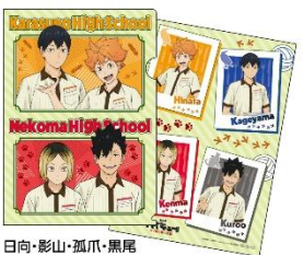
日向・影山・孤爪・黒尾