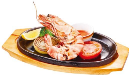
直火焼き皇帝海老のグリル 990 円（税込 1,089 円）

約 25 cm という、鉄板からはみ出すほど大きなシータイガーは、凝縮された海老の濃厚な旨みと風味、肉厚でジューシーな食べ応え、そして引き締まった身の弾力をお楽しみいただけます。まずはそのまま、次に別添えのチリソースをつけてお召し上がりください。