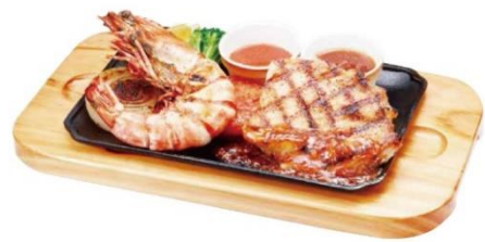
直火焼き皇帝海老のグリル&グリルチキン 1,390 円（税込 1,529 円）