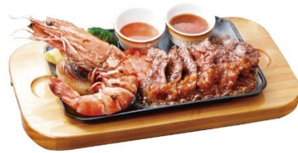
直火焼き皇帝海老のグリル&熟成カットステーキ 1,590 円（税込 1,749 円）