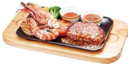
直火焼き皇帝海老のグリル&手ごねハンバーグ 1,390 円（税込 1,529 円）