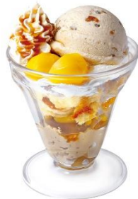
秋の贅沢 マロンパルフェ 380円 (税込 418円)