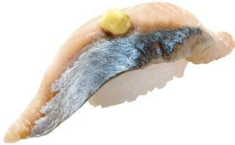
九州産生さば 100円 (税込 110円)