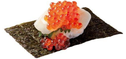
ほたていくらつつみ 〈北海道・青森県産ほたて使用〉 290円 (税込 319円)