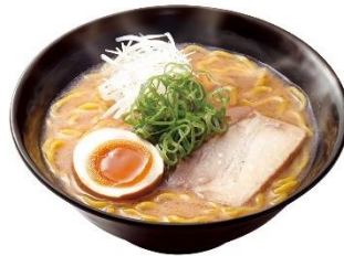
濃厚北海道味噌ラーメン 380円 (税込 418円)