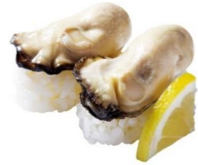
広島県産牡蠣握り 150円 (税込 165円)