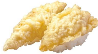
北海道水揚げほっけの天ぷら握り 100円 (税込 110円)