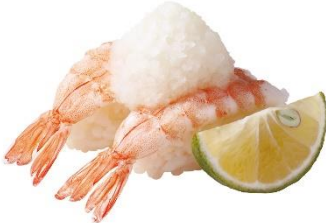
えび〈大分県産かぼすおろし〉 150円 (税込 165円)