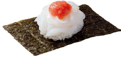
やりいかつつみ明太 150円 (税込 165円)