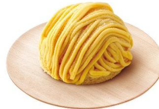
安納芋のおいもんぐらん 260円 (税込 286円)