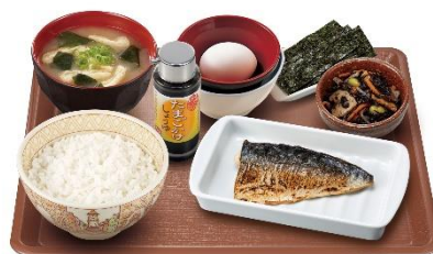
塩さばたまかけ朝食