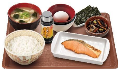
焼鮭たまかけ朝食