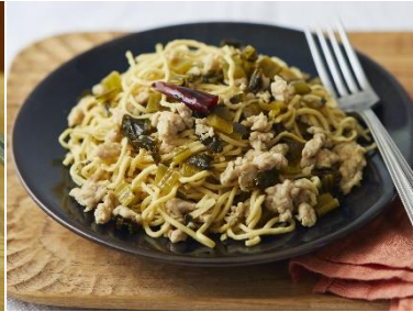
鶏ひきと高菜のピリ辛パスタ