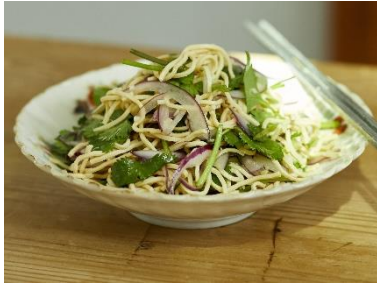
パクチーと紫玉ねぎのナンプラーレモンあえ