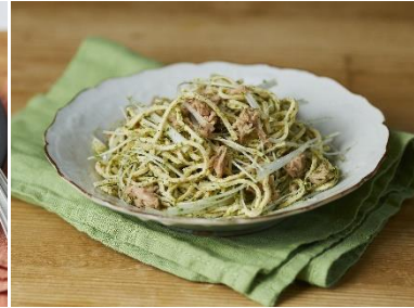
ツナの青のり山椒あえ