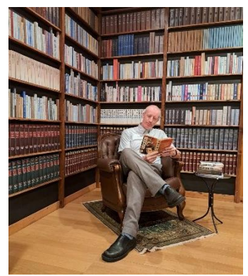
『探偵の書齋』フотスポット 江戸川乱歩館