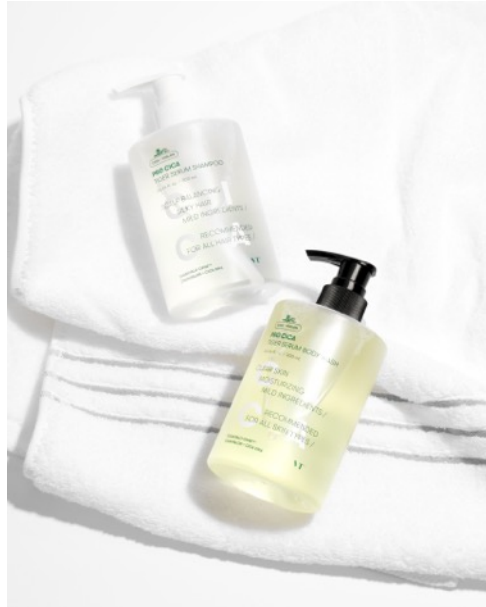
[写真] (左)VT プロ CICA タイガーセラムシャンプー300ml 2,310円(税込)、 (右)VT プロ CICA タイガーセラムボディウォッシュ300ml 1,980円(税込)

VT COSMETICS楽天市場店では注目の新商品を一早く手に取って頂けるよう、先行予約販売を実施しております。現在、VT プロ CICA ラインからシャンプーとボディウォッシュを絶賛販売中！フェイスクケアに比べるとつつい息りがちなボディケアやヘアケア。「VT プロ CICA タイガーセラムシャンプー」及び「VT プロ CICA タイガーセラムボディウォッシュ」は、アミノ酸系洗浄*成分配合の微酸性処方、肌に優しく使える商品を提供したいVTの思いによって生み出されたボディ&ヘアケア商品です。