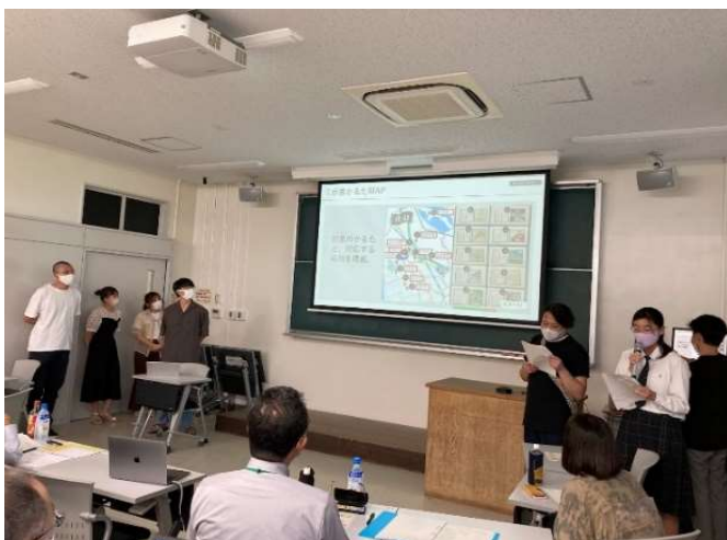
＜高校生・大学生によるプレゼンの様子＞

2022 年は、滋賀大学夏季集中講義にて企画者の高校生と大学生がチームを組んでアイデアをさらに練り上げ、共同で実現企画案を作成し、3 社幹部・彦根市にプレゼンテーションを行いました。