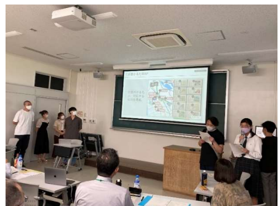
＜大学生によるプレゼンの様子＞

なお、今般2022年の高校生からのアイデアをもとに、滋賀大学夏季集中講義にて企画・選考を行った「彦根かるたで街おこし」の製作が決定いたしました。彦根の歴史や名所をモチーフにした郷土かるた「彦根かるた」を用いた企画で、彦根の魅力的なスポットの認知度向上・観光活性化に繋がることを期待しています。