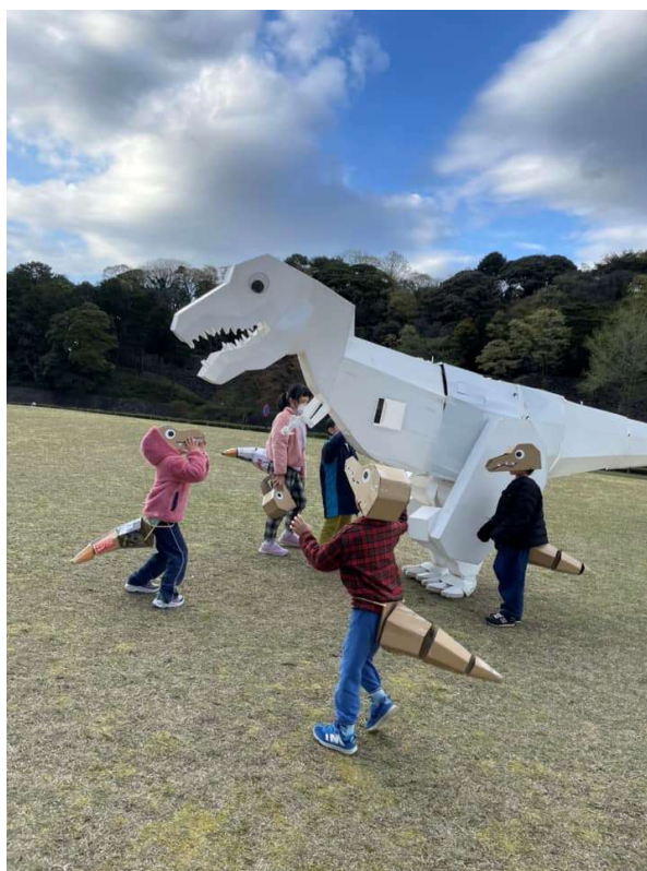
<子供たちが手作りしたミニ恐竜と「うちのシロ」>

夏休みに開催するこのイベントは、参加者を募集中です。アル・プラザ鯖江にぜひ、お越しください。