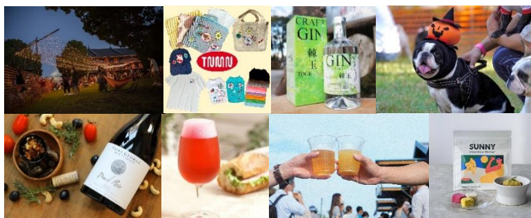
＜会場・販売グッズイメージ＞

横浜みなとみらい新港地区の臨海部に面する横浜赤レンガ倉庫、MARINE & WALK YOKOHAMA、横浜ハンマーヘッド、DREAM DOOR YOKOHAMA HAMMERHEADの4施設を結ぶ、横浜みなとみらい新港地区の水際プロムナードで、2023年10月7日（土）から10月9日（月・祝）の計3日間、今回で5回目となる『BAY WALK MARKET 2023』を開催します。海沿いの開放的な空間でお散歩しながら楽しめるマーケットとして、今年7月の開催では延べ20万人以上の方にご来場いただきました。