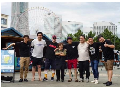
<前回 2023年7月開催の様子>

夏の開催に続き、横浜発のビールを一堂に最高のロケーションで楽しめる好評企画、「カンバイヨコハマ」を開催。ビール発祥の地、横浜では2023年4月現在、市内に13か所ものブルワリーがクラフトビールを製造しています。その中でも特にみなとみらい、馬車道、関内の徒歩圏内で7社ものクラフトビールメーカーが軒を連ねており全国でも稀に見るクラフトビール集積拠点となっています。本イベントでは各社のクラフトビール常時36種類をご提供いたします。さらに今回はDJブースを設置し、音楽を楽しみながらクラフトビールが味わえます。