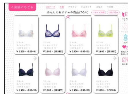
<接客 AI おすすめ商品>