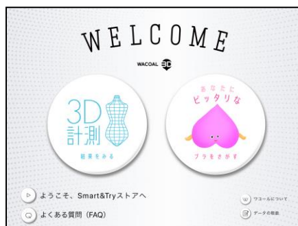
<接客 AI トップ画面>

また、からだの計測データやおすすめ商品、カウンセリングでお伺いした情報を、パーソナルシートとして発行することもできます。