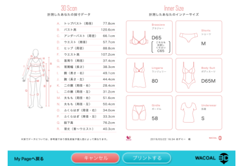
<計測データ・下着のサイズ>