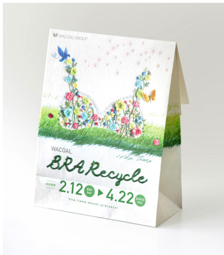
「メイド・フロム・ブラジャー」の「2015 ブラ・リサイクルバッグ」

(Wacoal×YouTuber特設サイト: http://www.wacoal.jp/youtuber/ )