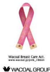
画像：「ピンクリボンフィッティングキャンペーン」店頭用報告パネル

ワコールグループでは、乳がんの早期発見・早期診断・早期治療支援活動である「ピンクリボン活動」の一環として、全国約2,050店舗の売場で「ピンクリボン・フィッティングキャンペーン」を実施しました。